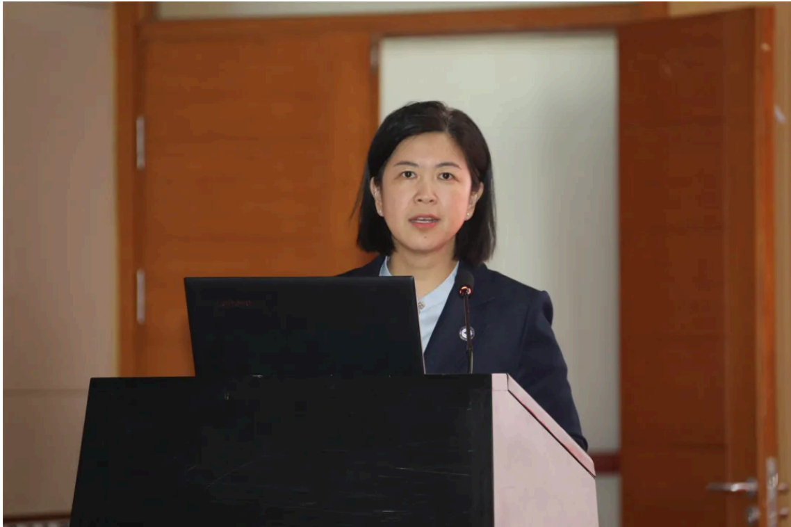
全国人大代表于洋宣讲中

宣讲中，丁洋代表以《十四届全国人大四次会议精神宣讲》为题，结合自身参会经历、一线履职实践，紧扣十四届全国人大四次会议核心议程与精神实质，结合会议审议的政府工作报告、“十五五”规划纲要、生态环境法典等重要内容，以及医疗卫生领域相关政策部署，用通俗的语言、鲜活的案例、透彻的阐释，全面系统、深入浅出地阐释了会议的核心要义、精神实质与实践要求，系统领会习近平总书记重要讲话精神，并围绕“十五五”时期健康中国建设、优质高效医疗卫生服务体系完善、医护人员权益保障等与医院发展、职工工作紧密相关的内容，作了全面深入的宣讲。她的宣讲主题鲜明、内涵丰富、贴合医疗工作实际，既有理论高度，又有实践温度，为全体参会人员上了一堂生动的政治课、理论课、实践课，让大家深受教育、备受鼓舞，进一步明晰了工作方向、凝聚了奋进共识。